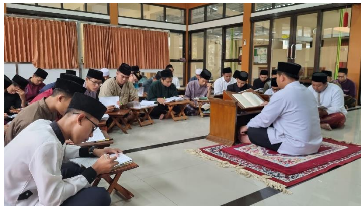
Gambar 03. Kajian Kitab Akhlaq