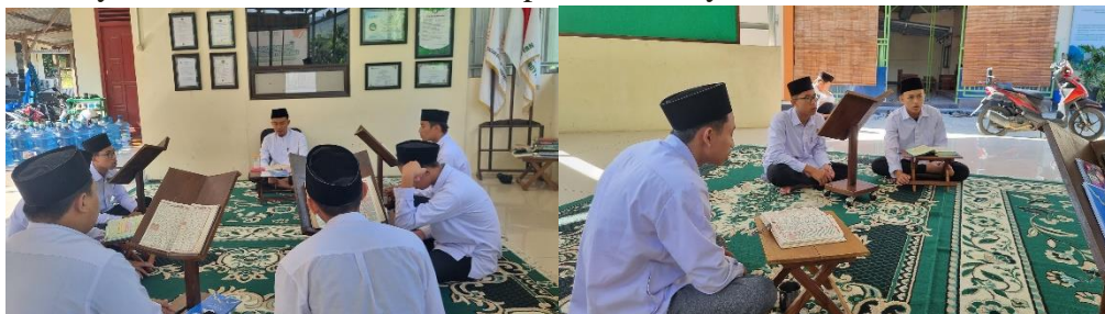
Gambar 02. Halaqah Tahfizh