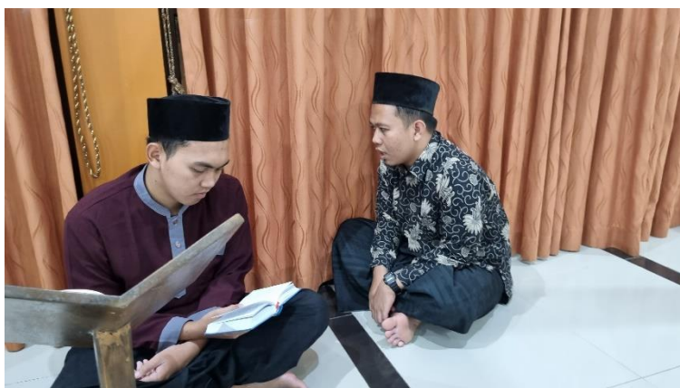
Gambar 04. Halaqah Hafalan Matan Ilmiah

Kemudian juga Kitab Al Waraqat yang membahas ilmu Ushul Fiqh. Sebagaimana disampaikan oleh (Az-Zuhail, 2024), Al-Waraqât merupakan kitab dasar ilmu Ushul Fiqih. Kitab yang dikarang ulama kenamaan mazhab Syafi'iyah, Imam Haramain al-Juwaini (w. 478 H), ini secara ringkas menjelaskan konsep-konsep dan kaidah-kaidah asasi dalam ilmu Ushul Fiqih sehingga sangat mudah dipelajari dan dihafal oleh pemula.