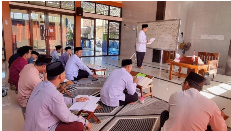
Gambar 05. KBM Fiqh di Kelas

Kemudian Kitab Al-Mukhtashar Al-Lathif yang merupakan matan ringkasan fikih Syafi'i yang hanya membahas permasalahan ibadah. Judul lengkap kitab ini ialah "Al-Mukhtashar Al-Lathif fi Al-Fiqh Asy-Syafi'i" atau Al-Mukhtashar Ash-Shaghir (Al-Lathif) li Al-Muqaddimah Al-Hadhramiyyah." Ia disusun oleh Syaikh Al-Allamah Al-Faqih Abdullah bin Abdurrahman Bafadhhal Al-Hadhrami Asy-Syafi'i (850-918 H) sebagai ringkasan dari kitab beliau yang berjudul Al-Mukhtashar Al-Kabir atau yang lebih masyhur dengan judul Al-Muqaddimah Al-Hadhramiyah atau Masaa'il At-Ta'lim (Gate, 2024).