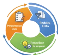
Analisis Data Miles & Huberman

Data kualitatif yang terkumpul akan dianalisis menggunakan teknik analisis data model interaktif (Miles & Huberman, 1994), yang meliputi tiga alur kegiatan yang terjadi secara bersamaan: