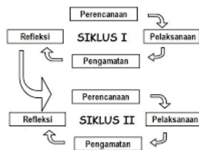
Gambar 1. Skema Penelitian (Kemmis, McTaggart, & Nixon, 2014)

Penelitian ini dilaksanakan dengan cara rancangan penelitian tindakan kelas (PTK). Penelitian ini bertujuan meningkatkan kemampuan bercerita pada anak usia 5-6 tahun di TKM Wasilatus Sa'adah Mangunrejo Kec. Kepanjen. Dengan jumlah subjek penelitian berjumlah anak 15 anak. Penelitian ini menggunakan model kolaboratif, artinya peneliti bekerjasama dengan guru kelas, peneliti sebagai pengajar dan guru kelas sebagai observer pada kegiatan penelitian yang akan dilakukan. Ciri khas dari Penelitian Tindakan Kelas (PTK) ialah pelaksanaannya yang berlangsung secara berulang atau bersiklus. Setiap siklus mencakup empat tahapan utama, yaitu perencanaan, pelaksanaan tindakan, observasi, serta refleksi (Purnama, Suci Rohmadheny, & Pratiwi, 2019). Adapun skema penelitian ini sebagai berikut: