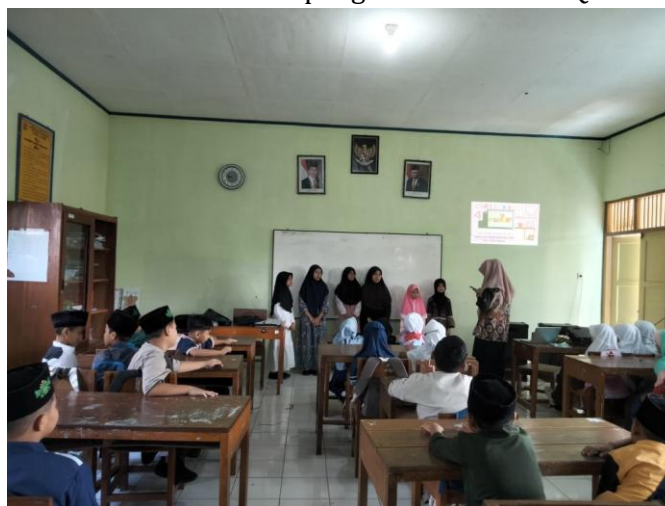
Gambar 1. Penggunaan media digital

Pemanfaatan media digital di MI Muhammadiyah Pasirmuncang menjadi bagian dari upaya madrasah dalam mengikuti perkembangan teknologi pendidikan sekaligus mendukung proses pembelajaran agar lebih variatif dan menarik. Guru memanfaatkan perangkat seperti proyektor, video pembelajaran, aplikasi membaca Al-Qur'an, serta platform belajar daring sederhana untuk memperkaya materi ajar. Penggunaan media digital ini membantu peserta didik memahami pelajaran dengan lebih visual dan interaktif, terutama pada mata pelajaran yang membutuhkan demonstrasi atau penjelasan konkret. Selain itu, beberapa guru menggunakan media digital untuk memutar murottal Qur'an sebagai pendamping kegiatan tadarus dan untuk memperbaiki tajwid peserta didik, sehingga teknologi turut dimanfaatkan dalam penguatan nilai-nilai Qur'ani.