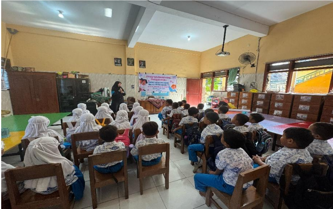
Gambar 2. Pelaksanaan Program Kemitraan Masyarakat

penting untuk mengatur berapa banyak dan jenis tidur yang didapat anak. Tidur, kenyamanan tidur, dan pola tidur merupakan indikator seberapa banyak dan nyenyaknya seorang anak tidur. Usia dan kematangan otak berkorelasi dengan perkembangan tidur anak (Dewi et al. 2024).