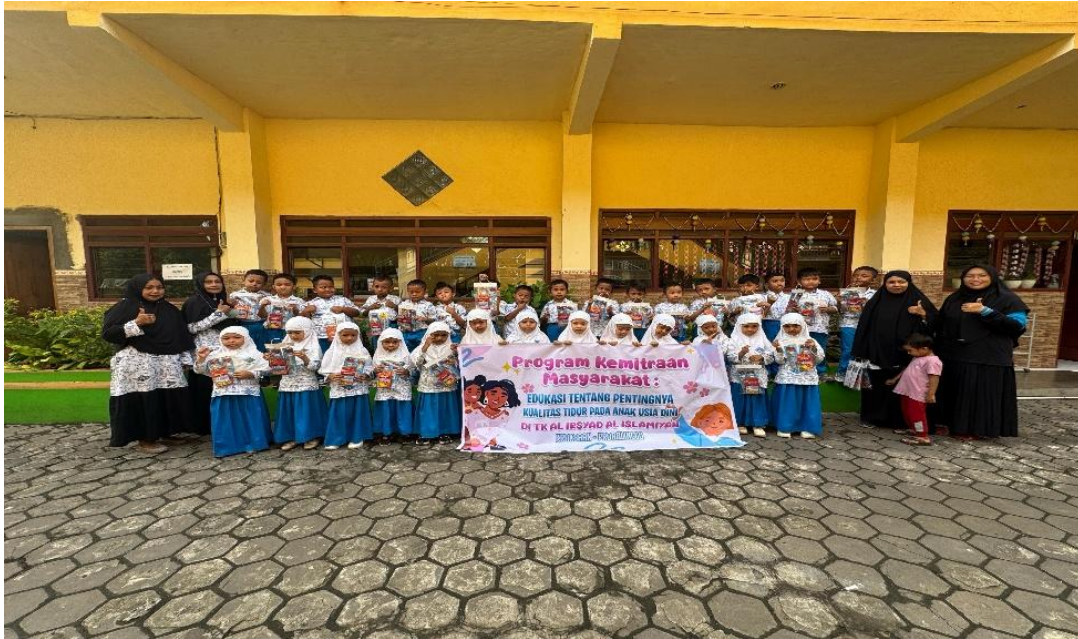
Gambar 3. Guru dan Siswa Taman Kanak-kanak

Tim pelaksana mengevaluasi hasil antara pre test dan post test . Hasil analisis menginformasikan bahwa terjadi peningkatan pengetahuan pada saat post test . Pendidikan kesehatan efektif untuk meningkatkan pengetahuan orang tua anak usia dini (4-6 tahun) tentang manfaat kualitas anak usia dini yang nantinya akan mempengaruhi kemandirian anak.