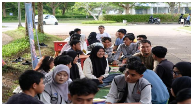
Gambar 1.2A Sesi Mendengarkan

Penerapan strategi pembelajaran melalui Jambi Fun Book mampu mengintegrasikan pendekatan kontekstual dan kreatif. Pendekatan kontekstual tercemin dari cerita peserta berdasarkan tema yang beragam, sebagai contoh, dokumentasi kegiatan pada gambar 1.2 menunjukkan sesi “mendengarkan” dalam Jambi Fun Book berhasil dalam menumbuhkan interaksi antara peserta, Hal ini bersifat krusial karena tema yang relevan dengan lingkungan dan budaya peserta cenderung lebih mudah dipahami dan menumbuhkan rasa kepemilikan. Melalui eksplorasi cerita-cerita tersebut, peserta tidak hanya mengembangkan kemampuan membaca tetapi juga memperkaya literasi budaya mereka. Penemuan ini juga sejalan dengan hasil pengabdian masyarakat yang menunjukkan bahwa komunitas, seperti Pohon Literasi yang dirancang oleh mahasiswa dan masyarakat sekolah berhasil meningkatkan partisipasi aktif, minat baca, serta menciptakan suasana belajar yang menyenangkan dan bermakna bagi siswa, (Ashar dan Idamayanti, 2025).