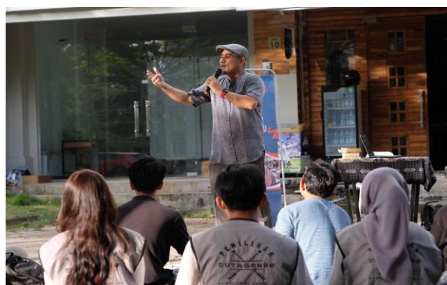
Gambar 1.2B Sesi Mendengarkan