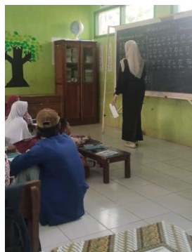
Gambar 2. Proses Pengenalan Aksara Sunda oleh Fasilitator

Pendekatan Content and Language Integrated Learning (CLIL) semakin banyak diterapkan di berbagai sekolah dasar sebagai strategi inovatif dalam meningkatkan kualitas pembelajaran. Di SD Negeri 2 Kertayasa, CLIL hadir bukan hanya sebagai metode pengajaran, tetapi juga sebagai upaya strategis untuk mempertemukan konten akademik dengan penguasaan bahasa secara bersamaan. Guru berperan penting dalam merancang aktivitas pembelajaran yang tidak hanya menekankan pada pencapaian materi, tetapi juga pada pengembangan kompetensi berbahasa. Melalui praktik ini, siswa diajak untuk terlibat aktif dalam kegiatan yang menuntut pemahaman konsep sekaligus keterampilan komunikasi. Proses ini menuntut guru untuk lebih kreatif dalam mengintegrasikan materi ajar dengan penggunaan bahasa yang kontekstual. Selain itu, kehadiran CLIL juga memberikan nuansa baru dalam ruang kelas yang lebih interaktif dan partisipatif. Tidak hanya guru, siswa pun didorong untuk lebih percaya diri dalam mengemukakan pendapat dan menjalin interaksi akademik. Hal ini mencerminkan bahwa CLIL di sekolah ini tidak sebatas eksperimen metodologis, melainkan juga bagian dari transformasi budaya belajar. Implementasi tersebut menunjukkan dinamika yang menarik untuk diteliti karena berimplikasi langsung pada kualitas pengalaman belajar siswa. Dengan demikian, praktik CLIL di SD Negeri 2 Kertayasa menjadi representasi konkret dari sinergi antara inovasi pedagogis dan kebutuhan pembelajaran abad ke-21.