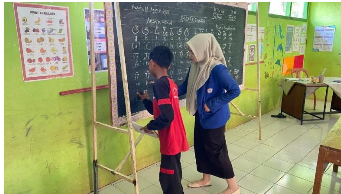
Gambar 4. Pendampingan Menulis Aksara Sunda oleh Fasilitator

begitu, pembelajaran tidak hanya membangun keterampilan kognitif, tetapi juga mengembangkan aspek afektif. Gambar ini menunjukkan bukti nyata bahwa siswa di SD Negeri 2 Kertayasa mulai lebih percaya diri menggunakan aksara Sunda.