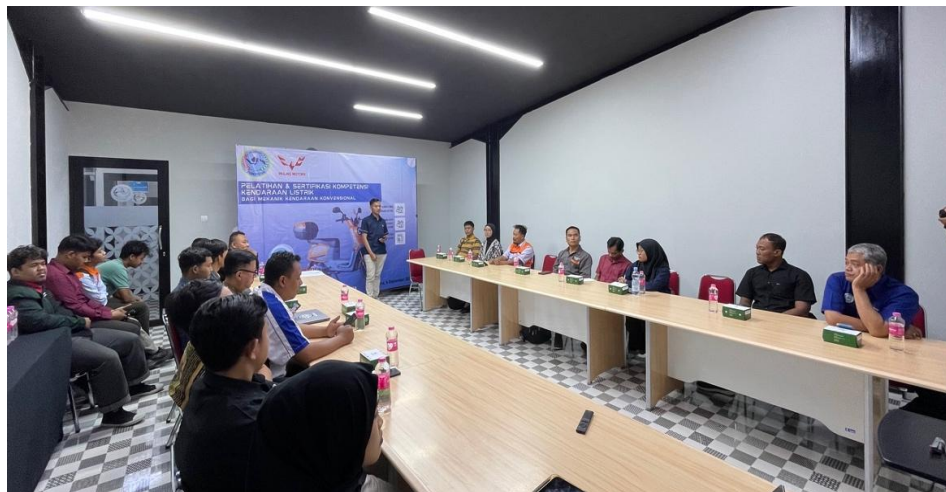
Gambar 4. Narasumber dari Wuling Motor

Narasumber dari Wuling Motors Indonesia memberikan materi teori mengenai perkembangan kendaraan listrik, prinsip kerja motor listrik, sistem baterai, dan BMS. Peserta mengikuti sesi presentasi serta diskusi interaktif untuk memperdalam pemahaman.