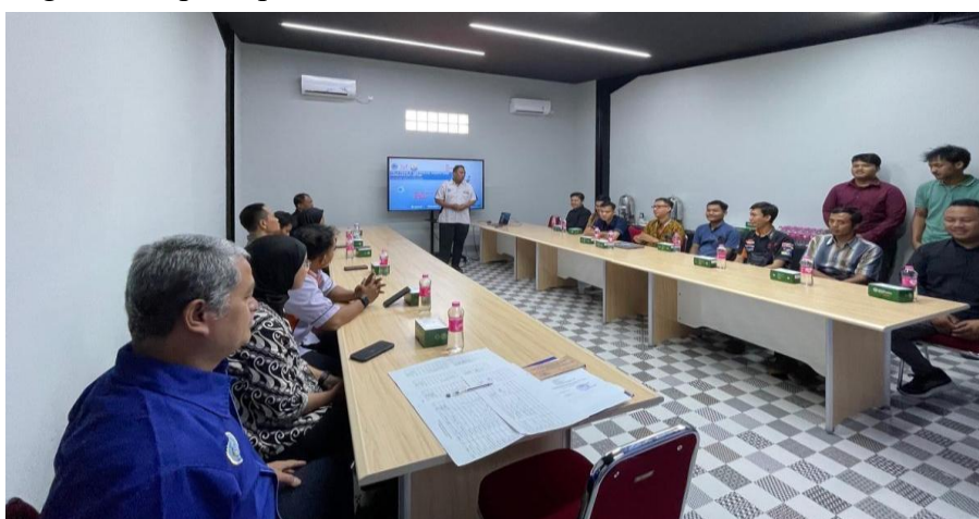
Gambar 3. Peserta Registrasi dan Pembukaan Pelatihan

Sosialisasi kegiatan dilakukan melalui undangan resmi kepada bengkel-bengkel sepeda motor di wilayah Soloraya. Sebanyak 20 mekanik mendaftar dan terpilih sebagai peserta pelatihan. Pada tahap ini juga dilakukan pendataan latar belakang keterampilan peserta.