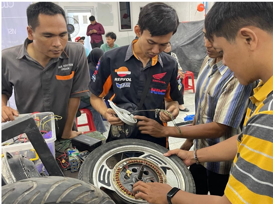
Gambar 5. Peserta melakukan praktik pemeriksaan baterai dan motor listrik dengan bimbingan instruktur

Peserta dilatih menggunakan alat peraga untuk memahami prosedur pemeriksaan sistem kendaraan listrik. Kegiatan praktik meliputi pengecekan tegangan baterai, pelepasan service plug , serta prosedur keselamatan kerja tegangan tinggi.