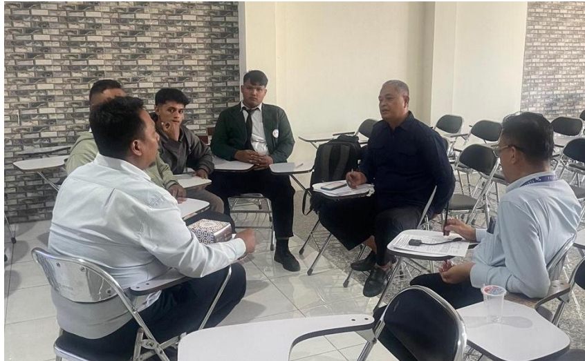
Gambar 2. Rapat koordinasi antara tim dosen dengan mitra

Gambar tersebut menunjukkan suasana rapat koordinasi yang dilaksanakan antara tim dosen Politeknik Indonusa Surakarta dengan mitra bengkel otomotif di wilayah Soloraya. Rapat ini bertujuan untuk menyamakan persepsi mengenai tujuan dan pelaksanaan kegiatan pengabdian masyarakat, khususnya terkait pelatihan kendaraan listrik. Dalam pertemuan tersebut dibahas peran masing-masing pihak, kebutuhan dukungan sarana prasarana, serta penentuan teknis pelaksanaan kegiatan mulai dari jadwal, materi, hingga metode evaluasi.