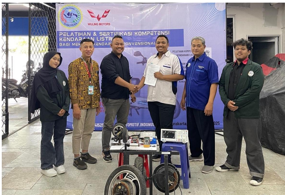
Gambar 6. Penyerahan Sertifikat kepada Peserta

Peserta yang menyelesaikan pelatihan mendapatkan sertifikat sebagai pengakuan kompetensi tambahan di bidang kendaraan listrik. Penyerahan sertifikat dilakukan oleh perwakilan Politeknik Indonusa Surakarta dan Wuling Motors Indonesia.