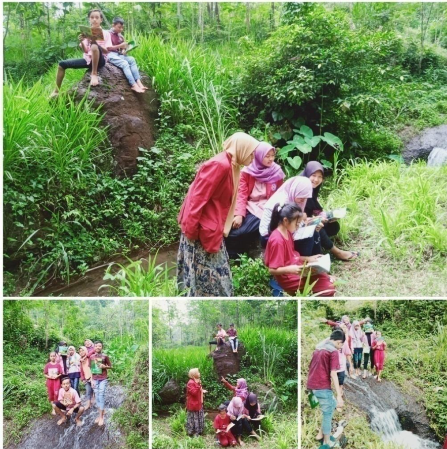
Gambar 5. Kegiatan membaca di tempat yang berbeda membaca di alam terbuka bertujuan untuk membaca lebih menyenangkan dan tidak membosankan.

Selain membaca ditempat rumah baca, pengabdian juga mengajak anak-anak membaca di tempat yang berbeda dimana tempat tersebut disukai oleh anak-anak karena tempat ini sering dikunjungi hanya sekedar untuk bermain, mandi, nyuci, dan cari ikan-ikan kecil. Tempat tersebut adalah sumber air kali di daerah dusun sentono tujuan pengabdian mengajak anak-anak ke tempat ini adalah menarik semangat anak-anak membaca lebih menyenangkan di alam terbuka serta bisa menghayati karunia tuhan yang telah diberikan.