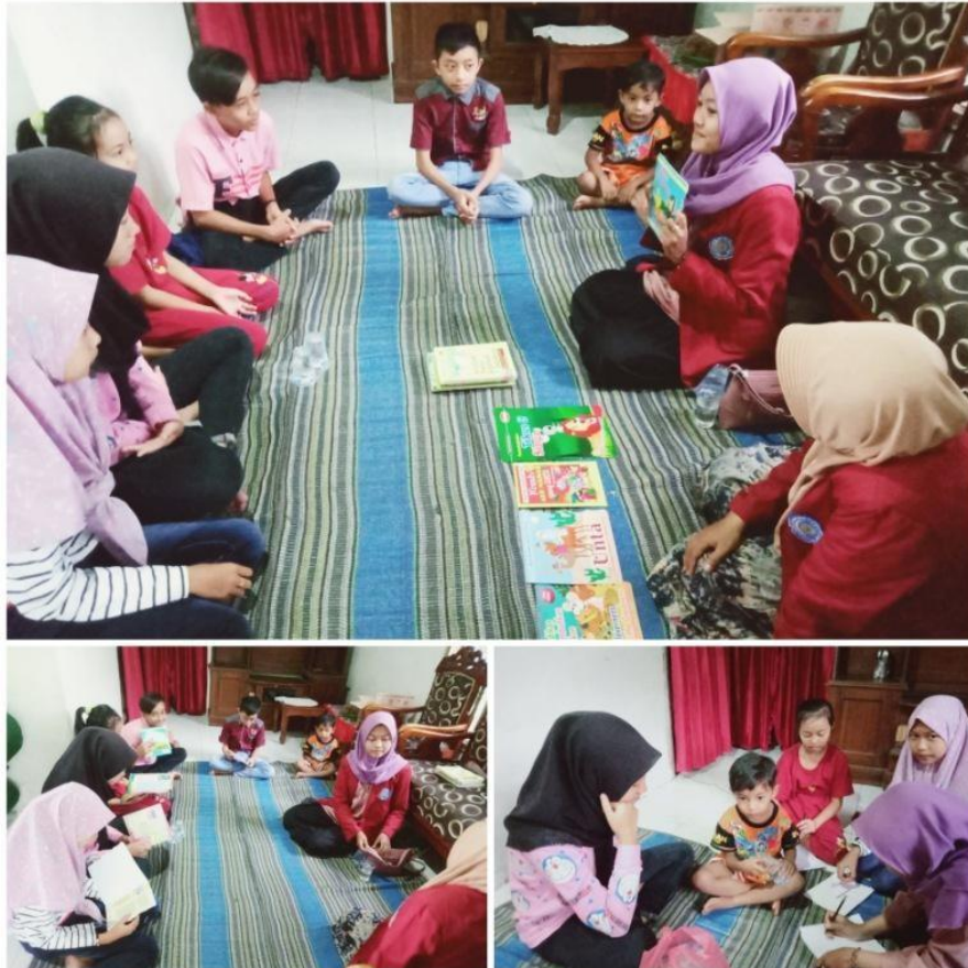
Gambar 2. Kegiatan membaca dan belajar anak usia sekolah.

Langkah berikutnya pengabdian langsung mengaktifkan program gerakan literasi rumah baca sebagai tempat anak-anak usia sekolah untuk meningkatkan minat membacanya. Program gerakan literasi rumah baca dilaksanakan dengan cara memberikan anak-anak beberapa ragam buku bacaan, juga memberikan buku yang didalamnya berisi tentang permainan. Dengan cara ini menjadikan strategi awal mengenalkan kepada anak-anak agar mereka bisa tertarik datang kerumah baca dan membaca buku yang sudah disediakan oleh pengabdian.