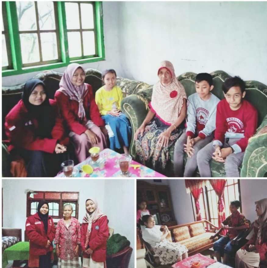
Gambar 1. Sosialisasi kepada orang tua anak tentang minat membaca di Dusun Sentono Desa Lambangkuning.

Langkah kedua pengabdian melakukan observer atau turun langsung kelapangan untuk mensurvei terkait masalah kurangnya minat membaca pada anak usia sekolah sekaligus mensosialisasikan bahwasanya membaca itu sangat penting kepada warga di Dusun Sentono RT 02 RW 01 Desa Lambangkuning untuk mendorong dan memotifasi anak agar kebiasaan mereka yang awalnya malas membaca dirubah menjadi suka membaca.