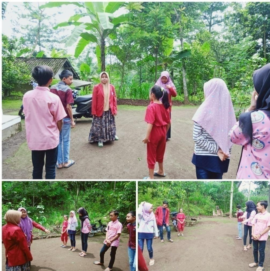
Gambar 4. Kegiatan bermain permainan tradisional.

pengabdian berupaya meningkatkan minat baca pada anak pengabdian juga memiliki program kreatif yaitu dalam program literasi minat baca ini Pengabdian menyelipkan permainan sambil belajar dengan anak-anak agar tidak merasa jenuh dan bosan. Permainannya adalah permainan tradisional bernama sodoran bergaris (permainan khas anak dusun sentono) permainan ini membutuhkan kerjasama tim yang kompak dimainkan oleh 2 kelompok (kelompok A dan kelompok B) masing-masing kapten kelompok harus bersuit untuk keadilan dalam bermain kelompok yang menang jadi pemain dan yang kalah jadi penjaga dan yang kalah suit ternyata kelompok A maka kelompok A sebagai penjaga dan kelompok B sebagai pemain. Kelompok B harus bisa melewati kelompok A, tanpa kena ditangkap atau disentuh oleh kelompok B begitu juga Kelompok A harus bisa menangkap kelompok B. Apabila salah satu dari kelompok B bisa melewati dari kelompok A maka kelompok B dapat poin dan apabila kelompok A bisa menangkap atau menyentuh kelompok B maka kelompok B yang jadi penjaga dan kelompok A jadi pemain, permainan ini dibatasi waktu setelah waktunya habis ternyata skor 10 permainan ini dimenangkan oleh kelompok B, dan kelompok yang menang mendapat hadiah dari pengabdian berupa buku bacaan cerita, dan yang kalah mendapatkan hukuman berupa disuruh menyanyikan 1 lagu kebangsaan kemudian dikasi buku juga seperti kelompok yang menang.