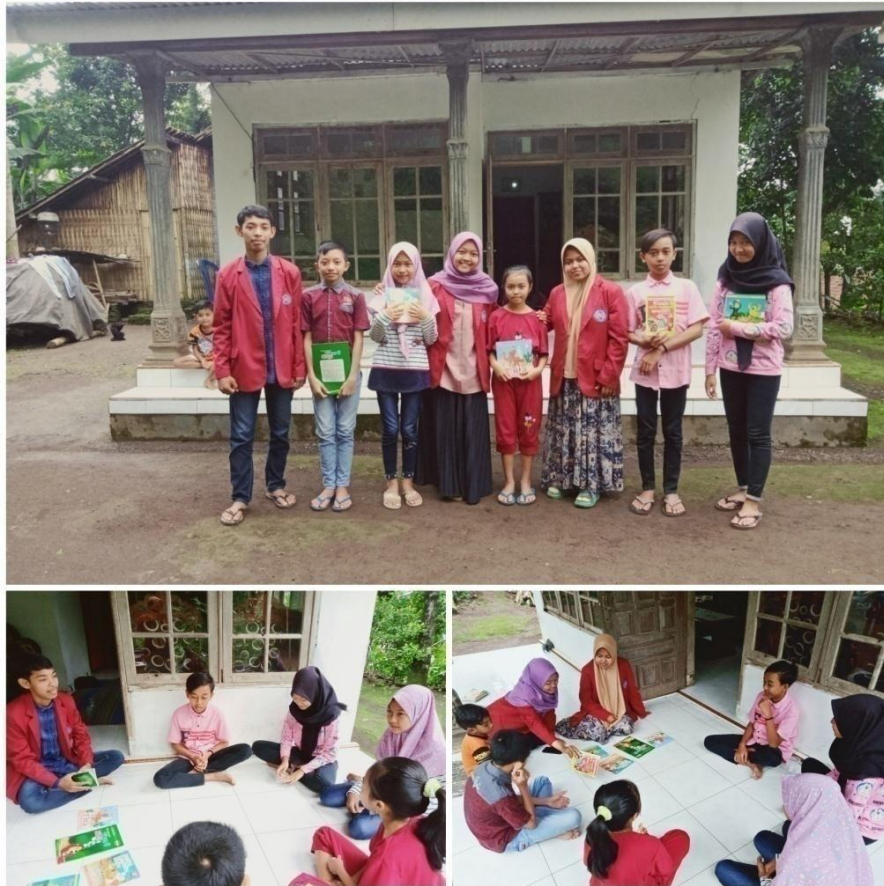
Gambar 3. Kegiatan mengajak anak untuk meningkatkan minat membacanya.

Setelah mereka sudah kenal dengan beragam buku bacaannya pengabdian terus berusaha mendorong anak-anak meningkatkan minat bacanya dengan memotivasi agar selalu mau melakukan kegiatan membaca serta jangan terlalu sering bermain gadget seperti game online, tiktok, facebook ataupun aplikasi yang ada di gadget yang memungkinkan jadi penyebab utama mereka terhambat proses membacanya,