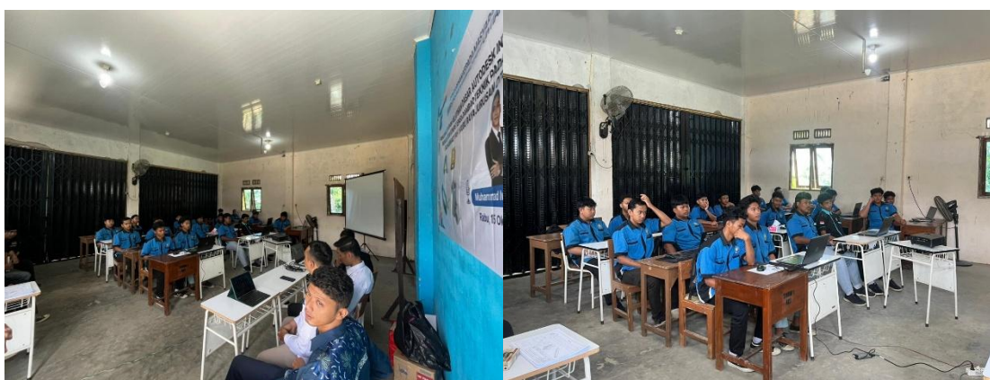
Gambar 3. Optimalisasi Muatan Lokal Dari Guru Terhadap Siswa.

Aplikasi yang dihasilkan guru tidak hanya berupa keterampilan pada guru tetapi juga materi yang berbasis pendekatan pada gambar 3. Beberapa hasil produk yang dikembangkan oleh guru mengangkat permasalahan nyata yang relevan dengan kehidupan nyata peserta didik, seperti pembuatan prototype alat alat pendukung otomotif seperti kunci kombinasi sampai dengan part part rumit yang selama ini hanya bisa digambar tapi tidak bisa dicetak dalam bentuk asli atau prototype. Praktikum tambahan pada mata pelajaran muatan lokal ini dapat memberikan ilmu baru pada guru dan siswa sehingga dapat meningkatkan kemampuan berpikir kritis dan kreatif peserta didik. Hal tersebut sesuai dengan hasil penelitian (Wigati et al., 2024) bahwa penggunaan aplikasi ultimaker CURA dan praktikum pada alat printer 3D Anet A8 plus merupakan suatu inovasi dalam pembelajaran yang dapat digunakan untuk meningkatkan kemampuan berpikir kreatif dan skill baru dalam dunia manufaktur.