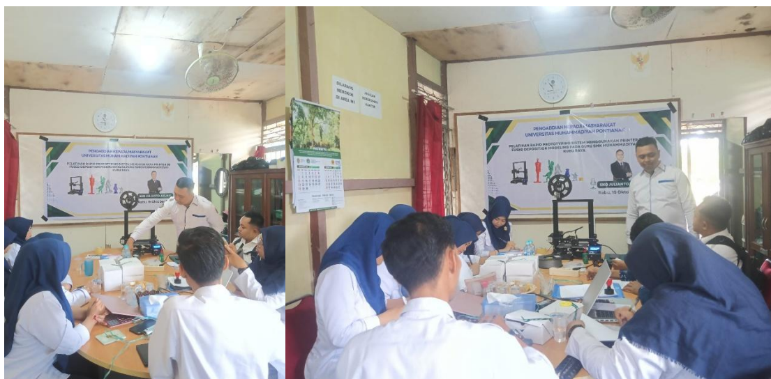
Gambar 2. Penguasaan printer 3D Anet A8 Plus

Melalui kegiatan pelatihan yang telah dilakukan, guru peserta pelatihan dapat mengenal, mempelajari, dan menerapkan praktikum mencetak benda kerja pada alat Printer 3D dalam pembelajaran sebagai media interaktif yang dapat digunakan untuk menyusun mencetak hasil gambar yang sudah di desain sebelumnya dalam gambar 3 dimensi. Hasil pelatihan menunjukkan bahwa peserta pelatihan memahami fungsi alat Anet A8 plus, Penguasaan aplikasi ultimaker cura pada anet A8 plus. Hasil pelatihan menunjukkan bahwa peserta pelatihan memahami fungsi dari menggambar pada komputer yaitu gambar 3 dimensidan langsung bisa dicetak sesuai komponen aslinya bahkan dalam bentuk prototype.