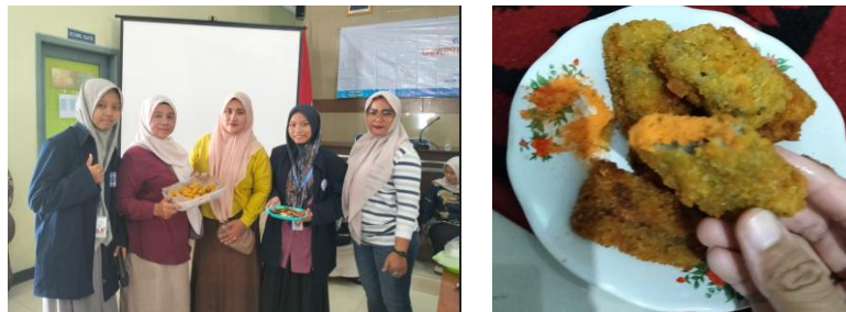
Gambar 5. Sesi Demonstrasi