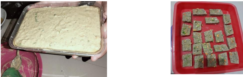
Gambar 4. Sesi Demonstrasi