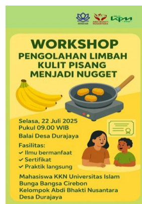
Gambar 1. Poster Kegiatan Workshop Pegolahan Limbah Kulit Pisang

Tanggal 16 Juli 2025 dilakukan persiapan materi workshop dirancang dengan mempertimbangkan tingkat pendidikan dan kemampuan fisik peserta yang beragam, dengan fokus khusus pada penguatan ketahanan pangan teman difabel. Modul pelatihan disusun dalam format visual yang menarik dengan bahasa sederhana, dilengkapi dengan panduan keamanan pengolahan pangan dan informasi gizi yang mudah dipahami. Tim juga menyiapkan seluruh peralatan dan bahan baku yang diperlukan, termasuk alat bantu yang ramah difabel dan protokol sanitasi yang dapat diadaptasi sesuai kemampuan fisik peserta. Gambar 1 berikut adalah poster kegiatan.