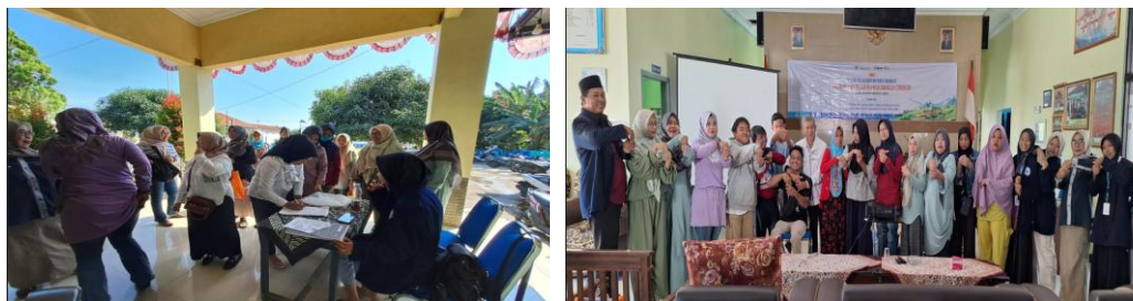
Gambar 2. Sesi Pembukaan