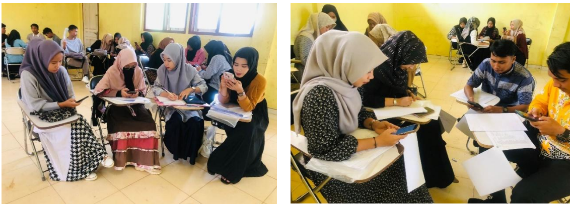
Gambar 1: Pendampingan Perancangan Konsep SL oleh Mahasiswa Kewirausahaan untuk Komunitas Dampungan guna Penguatan Ekonomi Keluarga

Tahap pra-layanan dilakukan sebagai fase diagnostik untuk memotret kebutuhan mitra, menentukan fokus intervensi, dan membangun kesepahaman program antara tim pengabdian dan pengurus Wanita NU Desa Tirta Mulya. Pada fase ini, temuan awal menunjukkan bahwa Wanita NU memiliki modal sosial yang kuat dalam bentuk jejaring jamaah, solidaritas antaranggota, serta tradisi kerja kolektif berbasis kegiatan sosial-keagamaan. Namun, modal sosial tersebut belum sepenuhnya dikonversi menjadi kapasitas kewirausahaan organisasi yang dikelola secara sistematis. Setelah itu dilakukan, tim pengabdian melakukan persiapan rancangan konsep SL untuk penguatan kewirausahaan perempuan NU bersama mahasiswa peserta SL, sebagaimana terlihat pada gambar di bawah ini: