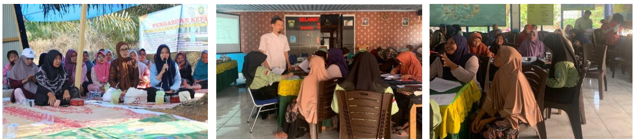
Gambar: Aksi Dampingan Penguatan Ekonomi dan Nilai Kepemimpinan Perempuan NU Pelepat Ilir, Bungo

Di bawah ini adalah beberapa dokumentasi terkait aksi Pelatihan Kepemimpinan Entrepreneurial dan Praktik Kewirausahaan Komunitas: