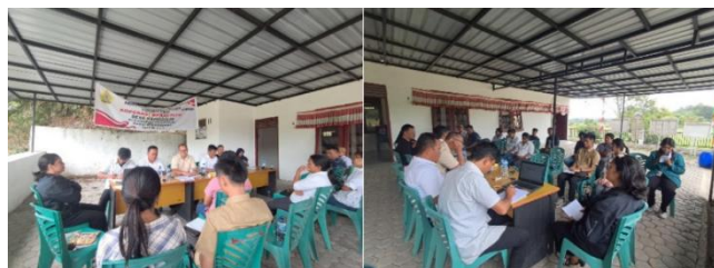
Gambar 1. Musyawarah Pembentukan TPK di Desa Nainggolan, Kecamatan Nainggolan, 2025.

Musyawarah ketahanan pangan tersebut melibatkan berbagai unsur yang memiliki peran strategis, yaitu Badan Permusyawaratan Desa (BPD), pemerintahan desa, pemerintahan kecamatan, masyarakat Desa Nainggolan, serta Penyuluh Pertanian Lapangan (PPL) bidang pertanian dan peternakan. Keterlibatan unsur-unsur tersebut mencerminkan adanya koordinasi lintas kelembagaan serta penerapan prinsip partisipatif dalam perencanaan program ketahanan pangan desa.