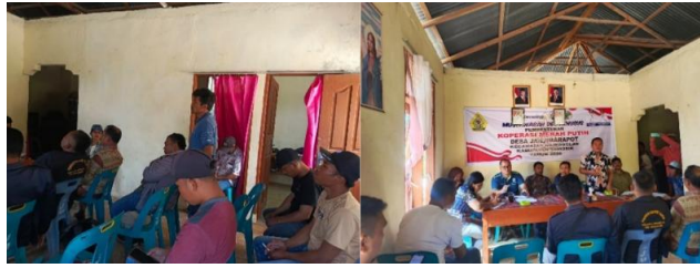
Gambar 2. Musyawarah Pembentukan TPK di Desa Janji Marapot, Kecamatan Nainggolan, 2025

diterapkan secara konsisten di wilayah Kecamatan Nainggolan, sehingga memudahkan koordinasi lintas desa dan pengawasan dari pemerintah kecamatan maupun kabupaten.