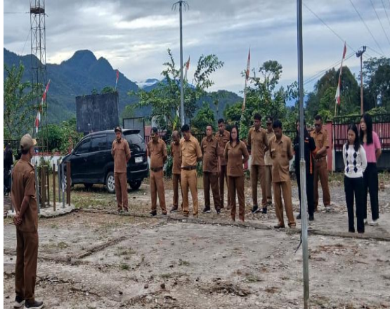
Gambar 1. Pelaksanaan pendampingan administrasi pemerintahan desa pada saat apel pagi

dan aset secara tertib sesuai Permendagri No. 47 Tahun 2016. Pendampingan ini bertujuan menciptakan pemerintahan desa yang transparan, akuntabel, dan efisien, serta meningkatkan pelayanan publik yang responsif.