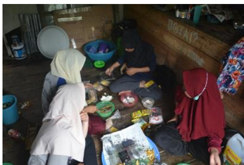
Gambar 5. Foto kegiatan pengolahan diversifikasi olahan pisang

Dengan adanya pelatihan ini, diharapkan peserta dapat meningkat keterampilan maupun pengetahuannya sehingga mampu untuk menghasilkan produk olahan pisang yang berkualitas, bervariasi, dan memiliki nilai ekonomi yang tinggi. Dengan demikian, diharapkan pula dapat tercipta peluang usaha yang berpotensi untuk meningkatkan penghasilan masyarakat di desa Pasir Putih, serta mendukung pembangunan ekonomi lokal di wilayah tersebut. Berikut dokumentasi kegiatan pelatihan yang dilakukan dalam diversifikasi olahan pisang menjadi keripik.