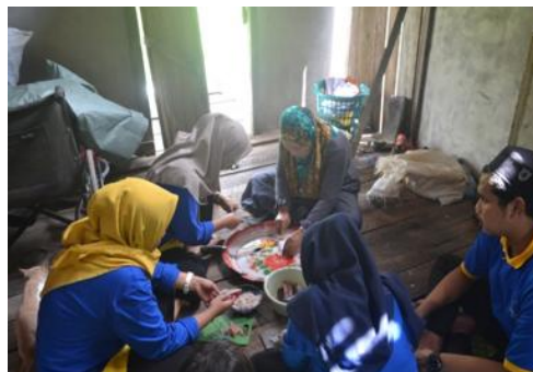
Gambar 3. Praktek pembuatan empek-empek bersama