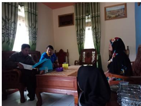
Gambar 2. Foto koordinasi dan diskusi dengan Kepala Desa Pasir Putih

Pengolahan ikan gabus menjadi empek-empek dengan cara praktek langsung terhadap ibu-ibu rumah tangga (IRT) dan ibu-ibu Pemberdayaan dan Kesejahteraan Keluarga (PKK) dengan tujuan ibu-ibu tersebut dapat termotivasi memanfaatkan potensi alam yang ada menjadi sesuatu produk olahan dari ikan gabus yang memiliki nilai jual dan bahkan dapat memperbaiki perekonomian di desa tersebut. Berikut adalah dokumentasi terkait kegiatan pelatihan ini.