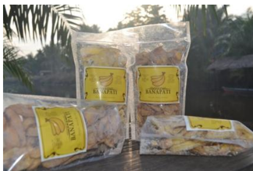
Gambar 6. Foto produk olahan pisang