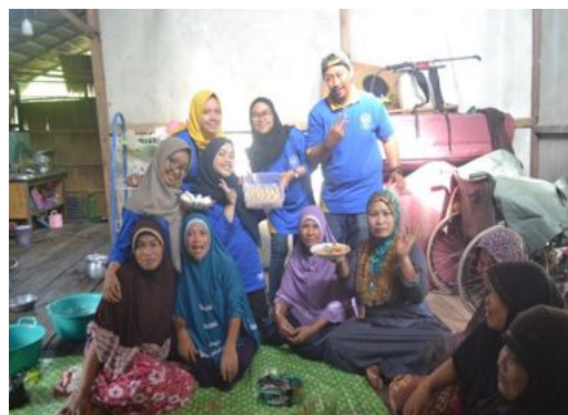
Gambar 4. Foto hasil empek-empek dari ikan gabus