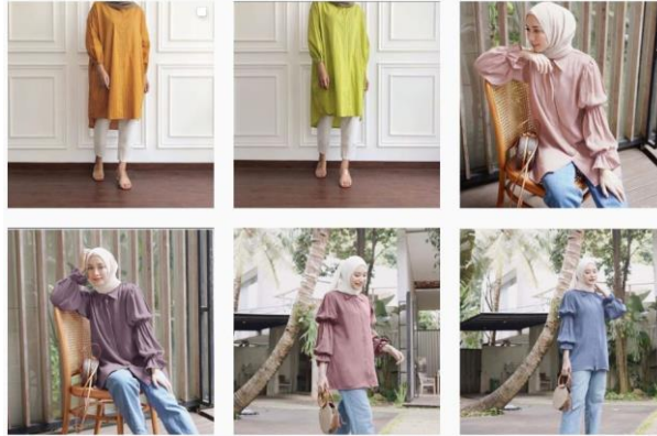
Gambar I.3. Format Order di Toko Chagiya