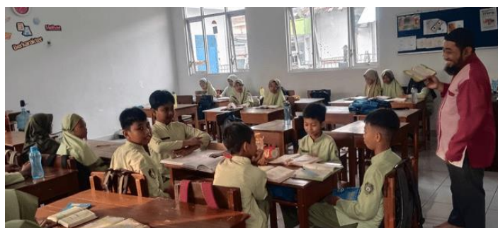
Gambar 3. Pengajaran Tahsin dan Tahfidz Al-Qur'an

Setelah lulus dari jilid 4 para siswa melanjutkan ketahap selanjutnya yaitu tahsin Al-Qur'an dan program tahfidz Al-Qur'an. Untuk program tahsin dan tahfidz pihak sekolah menyiapkan pengajar yang ahli dibidangnya dari guru ISMUBA dan merekrut ahli dari luar sekolah