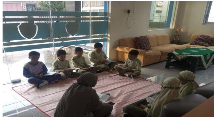
Gambar 2. Pengajaran Al-Qur'an dengan Metode Qiroati

Untuk melihat keberhasilan program dari setiap guru ISMUBA dan pengajar Al-Qur'an maka bisa dilihat dari target kemajuan para siswa dalam kemampuan membaca modul qiroati. setiap modul terdiri dari 60 halaman dan setelah selesai 1 modul maka akan di uji oleh satu guru yang paling mahir (sistem dengan ujian satu pintu). setelah lulus jilid satu maka bisa dinaikan ke jilid 2, 3 dan 4.