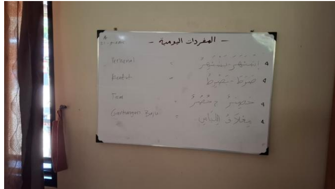
Gambar 5. Papan Mufradat Yaumiyah (Kosa kata Bahasa Arab)

pembelajaran bahasa Arab (Ramadhani & Sofa, 2025). Penggunaan bahasa Arab baik saat proses kegiatan belajar mengajar maupun diluar kegiatan belajar mengajar seperti di asrama, di masjid, di lapangan, bahkan di kamar mandi secara konsisten dapat membentuk kebiasaan serta dapat menambah kosakata baru yang dimiliki santri (Islami & Fadli, 2024).