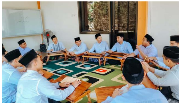
Gambar 4. Kegiatan Yaumul Ilmi

Kegiatan yaumul ilmi merupakan kegiatan rutin yang diadakan oleh PPTQ Ar-Royyan setiap 2 pekan sekali pada Hari Kamis. Adapun yang dimaksud kegiatan yaumul ilmi adalah kegiatan mengulang atau memurojaah semua pelajaran yang telah dipelajari dan dilakukan sebaya. Kegiatan ini diadakan dengan materi materi yang telah dipelajari semakin dipahami dan diingat santri.