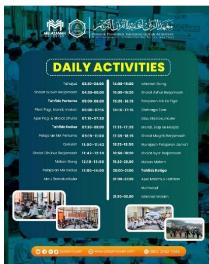
Gambar 7. Jadwal kegiatan santri MA Ar Royyan

Menurut santri yang di wawancara menerangkan bahwa “metode yang saat ini digunakan ( qawaid wa tarjamah ) sangat bagus, baik dan cukup menyenangkan. Tidak terlalu berat dan dapat dipahami”. Sedangkan menurut keterangan guru pengajar, bahwa “metode ini ( qawaid wa tarjamah ) secara sistematis tepat untuk santri. Karena pada metode ini santri dilatih untuk dapat membaca teks berbahsa arab dengan menerapkan kaidah yang telah dipelajari. Selain itu, pada metode tarjamah santri akan terbiasa memahami teks arab sekaligus terjemahannya ke dalam Bahasa Indonesia, sehingga harapannya selain santri bisa paham untuk dirinya sendiri, santru juga dapat memahami orang lain”.