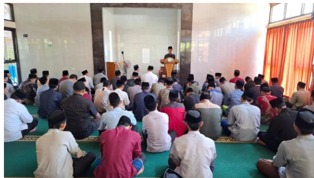
Gambar 6. Muhadhoroh

Muhadhoroh merupakan kegiatan yang digunakan untuk mempraktikkan kemampuan berbahasa arab. Kegiatan ini bertujuan untuk menjadikan santri memiliki keberanian untuk tampil di depan banyak pendengar. Melalui kegiatan ini santri juga dapat melatih pelafalan bahasa arab (Islami & Fadli, 2024).