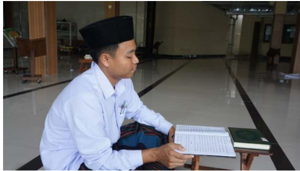
Gambar 3. Santri Belajar Mandiri

Jadwal kegiatan santri yang padat namun terstruktur seperti sholat berjamaah, belajar bersama, setoran hafalan, kegiatan pribadi, hingga belajar mandiri, mengharuskan santri untuk menggunakan waktu yang dimiliki secara efisien. Karena waktu menjadi sumber daya yang berharga dan harus digunakan dengan sebaik-baiknya, sehingga santri secara bertahap dapat menentukan prioritas serta menyusun strategi dalam menggunakan waktu untuk belajar dengan sebaik-baiknya (M. Zaka Marzuki & Siti rofi'ah, 2025).