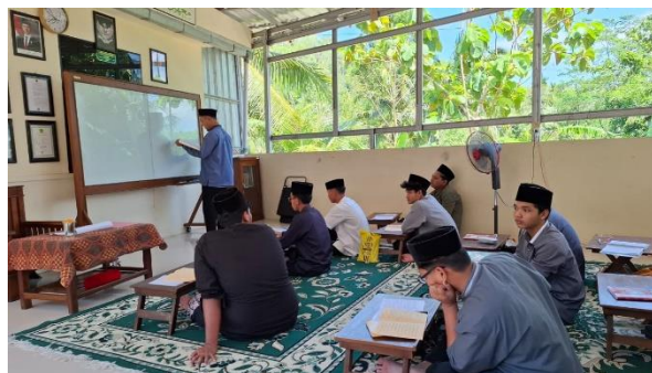
Gambar 2. Pembelajaran Bahasa Arab

Pembelajaran bahasa Arab menggunakan metode qawaid wa tarjamah di MA Ar-Royyan dilaksanakan setiap Hari Sabtu-Kamis pukul 09.40-11.00, ditambah belajar mandiri atau bersama teman di malam hari, serta program yaumul ilmi (mengulang pelajaran yang telah di pelajari) yang dilaksanakan setiap dua pekan sekali pada Hari Kamis.