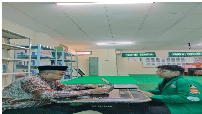
Gambar 3. Dokumentasi wawancara Guru Mapel PAI

Berdasarkan Tabel 3, guru PAI menekankan pentingnya pembelajaran yang mendorong refleksi peserta didik terhadap makna ajaran Islam serta penerapannya dalam kehidupan sehari-hari. Guru memandang keteladanan, pembiasaan sikap religius, dan diskusi nilai sebagai bagian penting dalam pembelajaran berbasis Deep Learning . Selain itu, guru juga berupaya mengaitkan materi PAI dengan konteks sosial dan pengalaman peserta didik agar pembelajaran bukan sekedar bersifat teoritis, tetapi lebih bermakna dan relevan dengan realitas yang dihadapi peserta didik.