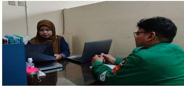
Gambar 5. Dokumentasi wawancara Wakil Kurikulum

Data pada Tabel 5 menunjukkan bahwa pihak sekolah, melalui Wakil Kepala Sekolah Bidang Kurikulum, memberikan dukungan yang cukup terhadap penerapan pembelajaran berbasis Deep Learning dalam pembelajaran PAI. Dukungan tersebut tercermin dalam kebijakan sekolah yang mendorong pembelajaran bermakna, pemberian ruang bagi guru untuk mengembangkan strategi pembelajaran yang kontekstual, serta upaya fasilitasi melalui kegiatan pelatihan dan pengembangan profesional guru. Selain itu, sekolah juga memberikan fleksibilitas dalam pengelolaan kurikulum agar guru dapat menyesuaikan pembelajaran dengan ciri yang dimiliki siswa dan kebutuhan pembelajaran PAI di kelas.