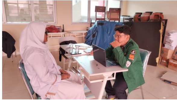
Gambar 4. Dokumentasi wawancara Peserta Didik

PAI menjadi lebih menarik, bermakna, dan membantu kamu memahami ajaran Islam lebih dalam? didik lebih tertarik tentang pengajaran agama islam dengan mengkolaborasikan antara digitalisasinya dan metodenya baik dalam penyampaian materi dan diberikan tugas untuk mencari materi sendiri setelah itu guru memberikan kuis di akhir.