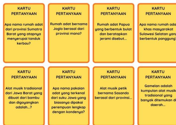
Gambar 2. Kartu Pertanyaan

Media Modusa juga dilengkapi kartu pertanyaan yang berisi soal-soal mengenai keberagaman budaya Indonesia. Selain itu, terdapat kartu pintar yang memuat informasi unik tentang budaya Indonesia, kartu kesempatan dan dana umum yang berisi instruksi permainan, kartu aset sebagai tanda kepemilikan daerah, serta kartu budaya yang digunakan sebagai alat transaksi permainan.