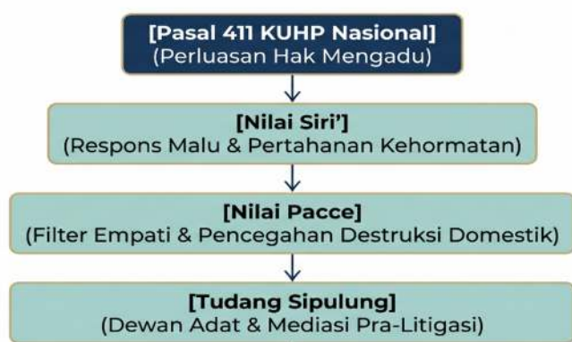
Gambar 1. Bagan Konsep

Analisis dokumenter terhadap 24 berkas perkara, yang dikuatkan oleh data wawancara, mengungkapkan bahwa sebagian besar sengketa terkait perzinaan di Parepare tidak bergerak langsung dari temuan pelanggaran ke pengaduan formal. Sebaliknya, sengketa-sengketa tersebut melewati urutan respons informal yang tertata secara normatif, diatur oleh dualisme nilai Siri' (pertahanan kehormatan) dan Pacce (kepatutan empatik).