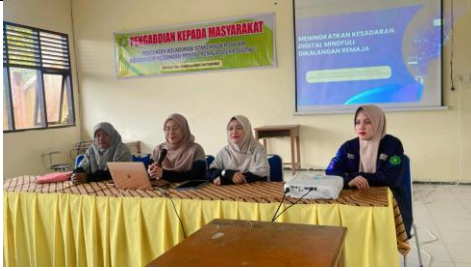
Presentasi materi oleh tim pengabdian masyarakat