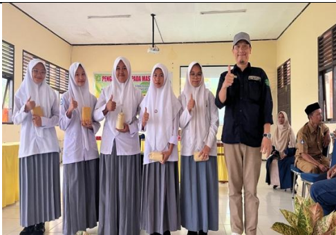
Pemberian hadiah dari kuis sekaligus praktek digita Mindfull