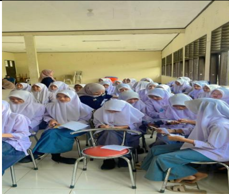
Pengisian pre test dan post tes