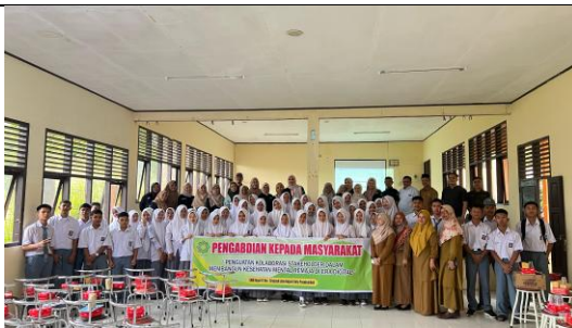
Foto Bersama dengan panitian dan peserta di akhir acara