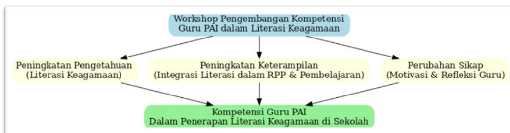
Gambar 2. Bagan Kerangka Berpikir Penelitian

Formulasi ini selaras dengan analisis yang menggunakan uji-t berpasangan (paired sample t-test), untuk melihat signifikansi perbedaan nilai pre-test dan post-test. Sedangkan untuk pertanyaan penelitian (kualitatif) yaitu pertanyaan penelitian digunakan untuk menggali pengalaman guru PAI secara mendalam terkait efektivitas