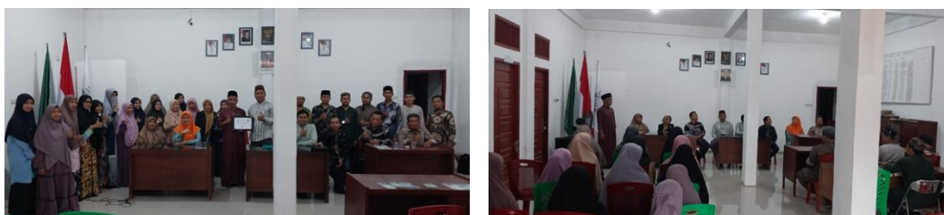
Gambar 3. Kegiatan Workshop Pengembangan Kompetensi Guru PAI

Dengan demikian, dapat disimpulkan bahwa hasil kuantitatif penelitian ini memberikan bukti empiris bahwa workshop pengembangan kompetensi guru PAI efektif dalam meningkatkan kualitas pembelajaran berbasis literasi keagamaan. Peningkatan skor rata-rata sebesar 12,2 poin mencerminkan keberhasilan program dalam menjawab kebutuhan guru. Lebih dari itu, hasil ini juga menjadi dasar bagi sekolah dan pemangku kebijakan pendidikan untuk mengadopsi program serupa secara berkelanjutan. Peningkatan yang konsisten di berbagai aspek kompetensi guru menunjukkan bahwa workshop merupakan strategi yang tepat dalam mendukung profesionalisme guru PAI dan memperkuat implementasi literasi keagamaan di sekolah.