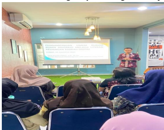
Gambar 3. Pelaksanaan Pendampingan UMKM

Berdasarkan gambar 2, pelaksanaan pendampingan para pelaku usaha UMKM dilaksanakan pada tanggal 29 Agustus 2025 di Rumah BUMN Sidoarjo. Terdapat ruang khusus yang telah dilengkapi proyektor, layar, kursi dan pencahayaan yang baik sehingga membuat para pelaku usaha UMKM nyaman dan fokus ketika menerima pendampingan UMKM. Selain itu, terdapat kalimat-kalimat motivasi di beberapa bagian Rumah BUMN Sidoarjo yang menginspirasi para pelaku usaha UMKM untuk menjadi lebih baik lagi. Pada awal pendampingan, para pelaku usaha UMKM menerima materi tentang pengertian literasi keuangan syariah digital dari penulis.