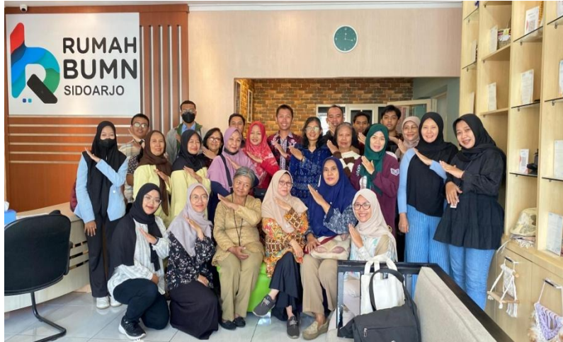
Gambar 4. Pelaksanaan Pendampingan UMKM

keuangan syariah digital. Sesi diskusi interaktif ini berlangsung dengan hangat dan terjadi komunikasi dua arah antara para pelaku usaha UMKM Rumah BUMN Sidoarjo dengan penulis sehingga para pelaku usaha UMKM dapat mengutarakan permasalahannya dan keinginannya secara terbuka dan lengkap.