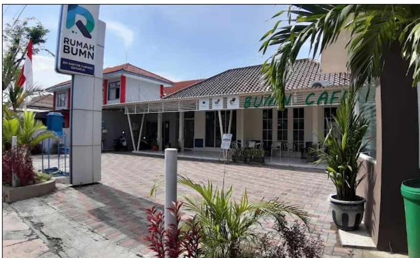
Gambar 1. Tampilan Depan Rumah BUMN Sidoarjo

Dalam era modern saat ini, pengetahuan dan pemahaman masyarakat termasuk UMKM tentang literasi keuangan syariah digital masih perlu ditingkatkan lagi. Pengabdian masyarakat ini menggunakan beberapa indikator untuk mengukur literasi keuangan syariah digital meliputi pengetahuan produk keuangan syariah, minat menggunakan produk keuangan syariah, pemahaman bahaya pinjaman online bukan dari bank, dan pemahaman bahaya judi online.