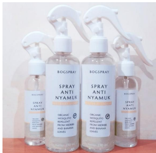
Gambar 3. Produk Jadi Spray Anti Nyamuk

linen spray yang dihasilkan tetap terjaga integritas kimianya. Produk akhir yang dihasilkan kemudian dikemas dalam botol spray ekonomis dan diberi label yang menarik untuk memberikan nilai tambah secara komersial. Gambar 3 berikut ini menampilkan produk jadi hasil karya peserta yang siap digunakan sebagai pelindung dari gigitan nyamuk sekaligus sebagai aroma terapi ruangan yang menyegarkan. Keberhasilan menciptakan produk fisik ini memberikan kebanggaan tersendiri bagi warga Dusun Beton, karena mereka menyadari bahwa limbah yang biasanya dijual murah seharga Rp3.500 per kilogram kini telah bertransformasi menjadi produk bernilai ekonomi tinggi.