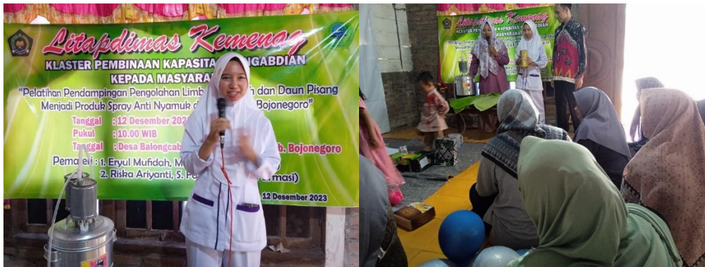
Gambar 1. Proses Identifikasi Aset Lokal, dan Sosialisasi Program kepada Komunitas

Uraian di atas menjelaskan bahwa Gambar 1 mencerminkan tahapan Discovery dalam metode ABCD, di mana warga tidak lagi dipandang sebagai objek masalah tetapi sebagai pemilik solusi atas limbah yang melimpah di lingkungan mereka. Setelah kesadaran kolektif terbentuk, kegiatan dilanjutkan dengan demonstrasi teknis mengenai proses destilasi sederhana untuk mengekstraksi senyawa aktif dari pelepah dan daun pisang. Proses ini melibatkan pengirisan bahan baku secara presisi untuk mengoptimalkan keluarnya minyak atsiri dan zat fitokimia lainnya saat proses pemanasan berlangsung. Gambar 2 memperlihatkan secara detail bagaimana perangkat destilasi sederhana dioperasikan oleh peserta, mulai dari penyiapan bahan baku seberat 500 gram pelepah dan 300 gram daun pisang hingga proses tetesan pertama cairan destilat yang bening dan aromatik berhasil didapatkan.