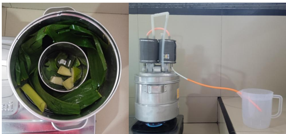
Gambar 2. Demonstrasi Teknik Destilasi dan Ekstraksi Senyawa Aktif dari Pelepah dan Daun Pisang

Uraian di atas menjelaskan bahwa Gambar 1 mencerminkan tahapan Discovery dalam metode ABCD, di mana warga tidak lagi dipandang sebagai objek masalah tetapi sebagai pemilik solusi atas limbah yang melimpah di lingkungan mereka. Setelah kesadaran kolektif terbentuk, kegiatan dilanjutkan dengan demonstrasi teknis mengenai proses destilasi sederhana untuk mengekstraksi senyawa aktif dari pelepah dan daun pisang. Proses ini melibatkan pengirisan bahan baku secara presisi untuk mengoptimalkan keluarnya minyak atsiri dan zat fitokimia lainnya saat proses pemanasan berlangsung. Gambar 2 memperlihatkan secara detail bagaimana perangkat destilasi sederhana dioperasikan oleh peserta, mulai dari penyiapan bahan baku seberat 500 gram pelepah dan 300 gram daun pisang hingga proses tetesan pertama cairan destilat yang bening dan aromatik berhasil didapatkan.