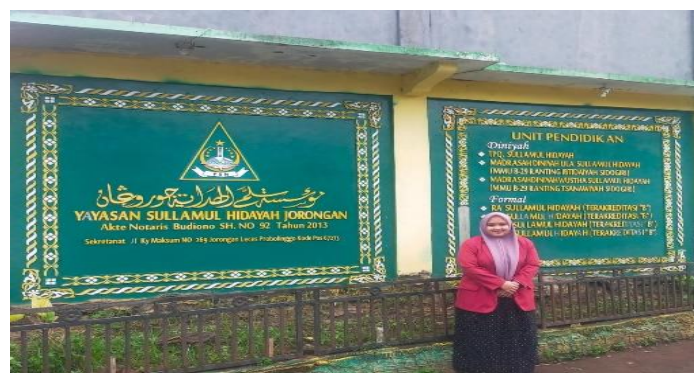
Gambar 1. Pesantren Sullamul Hidayah Probolinggo