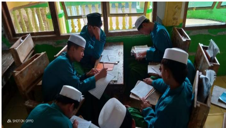
Gambar 3. Praktik Metode al-Miftah di Pesantren Sullamul Hidayah

Konsep tersebut merupakan salah satu yang efektif diterapkan pada pembelajaran dengan metode al-Miftah untuk santri di tingkat dasar sampai menengah di pesantren Sullamul Hidayah. Pada akhir wawancara salah satu pengajar di pesantren Sullamul Hidayah juga menambahkan pendapatnya bahwa hubungan yang baik antara pengajar dan santri juga sangat berpengaruh bagi keefektifan dalam pembelajaran sehingga dapat menjadikan suasana pembelajaran semakin lancar dan tidak menegangkan. Dalam hal ini peneliti menambahkan penjelasan bahwa metode al-Miftah ini garis besarnya berkonsep mempelajari materi dasar ilmu nahwu secara praktis, seru menyenangkan dengan cara menghafal materi sesuai jilid dan juga disertai dengan lagu-lagu yang telah disesuaikan yang mana metode ini memang ditujukan kepada anak usia dini. (Rozi & Zubaidi, 2019)