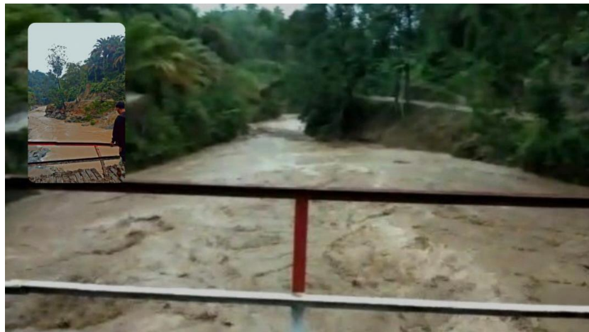
Gambar 2 : Sungai meluap

masyarakat kualitas pengetahuan mereka rendah. Mereka menganggap kebenaran pengetahuan berdasarkan mitos bukan pada riset dan penelitian Padahal sebaliknya. (Farihah, 2015) ini menjadi masalah baru yang terus bergulir dan menjadi tonggak awal mereka mendesak ratib tolak bala. Masyarakat menganggap musibah meluapnya debit sungai ini secara terus menerus adalah sebab sungai meminta tumbal. Tumbal berupa seekor kepala kambing jantan yang dibuang ke sungai, Tumbal ini harus dilakukan supaya tidak menelan korban jiwa manusia dan agar sungai kembali normal. Tentunya ini didasari karena ketakutan masyarakat tewas sebagai tumbal. Anggapan seperti ini termasuk ke dalam syirik yang sangat tegas dilarang oleh Allah SWT.