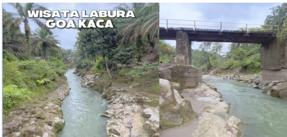
Gambar 1 : Aliran sungai desa Meranti Omas

Kecamatan NA IX-X merupakan daerah yang memiliki banyak sungai-sungai jernih, asri dan sejuk seperti sungai desa Meranti Omas beserta terus alirannya hingga ke kelurahan Kota Batu yang mana ini menjadi demonstrasi kebutuhan primer masyarakat. Selain itu, banyak masyarakat yang mengandalkan sungai ini sebagai mata pencaharian untuk memenuhi kebutuhan hidup, sandang dan pangan yakni dengan berjualan karena memang sungai ini dijadikan sebagai objek wisata. Disekitaran sungai juga terdapat banyak sekali air mata air yang keluar dari pecahan batu yang memiliki rasa manis dan menyegarkan. Air ini ditampung oleh masyarakat untuk dijadikan air minum rumah dan ada juga yang membuka usaha dengan produk air isi ulang galon. Melihat anugerah ini yang sangat bermanfaat bagi masyarakat sudah pastilah mereka sangat amat betul menjaganya dari pencemaran lingkungan dan tidak ingin potensi ini hilang begitu saja.