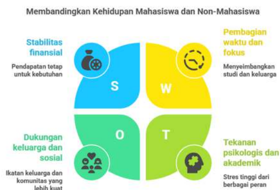
Gambar 2. Membandingkan Kehidupan Mahasiswa dan Non-Mahasiswa

Perbedaan Pemenuhan Hak dan Kewajiban antara Pasangan Mahasiswa dan Non-Mahasiswa Terdapat perbedaan yang cukup mencolok antara pasangan suami istri yang masih berstatus mahasiswa dengan pasangan yang tidak sedang menempuh pendidikan tinggi. Perbedaan ini dipengaruhi oleh sejumlah faktor yang berkaitan erat dengan kondisi dan peran mereka dalam kehidupan sehari-hari (Ummah, 2019).